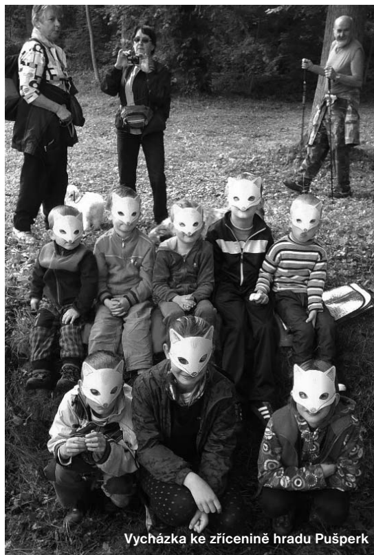
Vycházka ke zřícenině hradu Pušperk

Na Zíchov jsme se vydali v neděli v rekordním počtu bezmála 70 lidí a společně spolu strávili příjemných 6 hodin. Tentokrát nás vedly děti, které obdržely vytištěné mapy a na vyznačených stanovištích plnily připravené úkoly. Největší úspěch ovšem měl téměř hodinový program střílení z luků, který jsme pro děti zajistili na louce vedle Zíchovské hospůdky, kde jsme se všichni občerstvili. Dalším příjemným zpestřením byla přednáška pana Josefa Babky v místě zíchovské tvrze, která v minulosti patřila pánům z Roupova. Vycházku jsme zakončili v hostinci Na poustevně, kde všechny děti dostaly za odměnu nanuka.