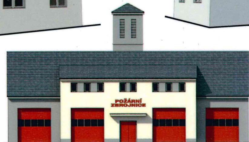
VIZUALIZACE - VARIANTA 3 POŽÁRNÍ ZBRŮJNICE V CHUDENICÍCH