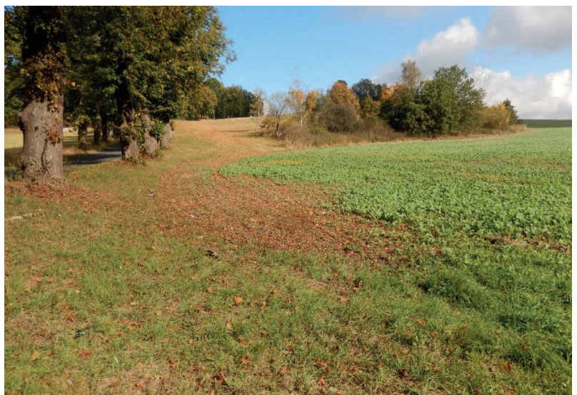
Lokalita jižně od Lučice – obnova polní cesty

Přes některé nepříznivé okolnosti objek-