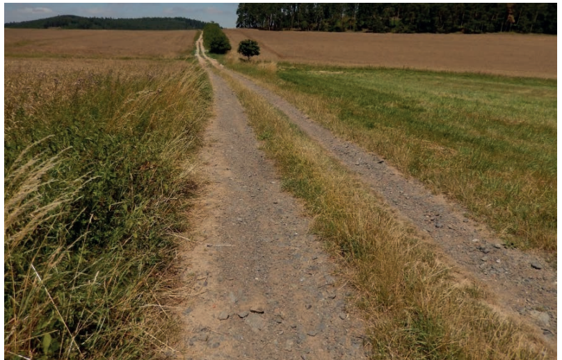
Polní cesta z Chudenic k Výšensku – úsek k doplnění oboustranné aleje

V těchto dnech je tomu právě rok, kdy jsme odevzdávali v Chudenicích výsledek našeho téměř ročního snažení – „Studii využití a ochrany krajiny Chudenic“. Krajinářská studie byla zpracována na základě objednávky a ve spolupráci s vedením městyse a měla tři hlavní cíle. Za prvé – formulovat hlavní zásady využívání krajiny pro zachování stávajících hodnot jednotlivých složek životního prostředí. Za druhé – specifikovat možnosti zlepšení stavu a funkce jednotlivých krajinných složek (péče o zeleň, budování malých vodních nádrží ve vhodných lokalitách, zlepšování kvality zemědělské půdy). Za třetí – vyhledat vhodné finanční nástroje pro financování navržených opatření.