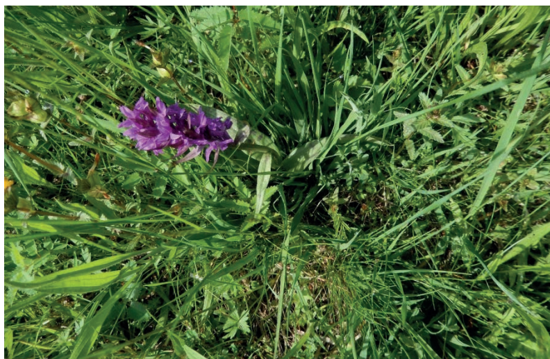
VKP Úvary II u Bezpravovic – prstnatec májový ( Dactylorhiza majalis ) patřil dříve k našim nejvíce rozšířeným orchidejím

Závěrem bychom chtěli vyjádřit poděkování představitelům obce za vstřícnost a vyjádřit přesvědčení, že v nadcházejícím roce 2021 se z konkrétních výsledků vzájemné spolupráce budou moci těšit jak obyvatelé městyse, tak i návštěvníci, kteří každoročně přijíždějí na Chudenicko s cílem objevovat a obdivovat jeho přírodu a historii.